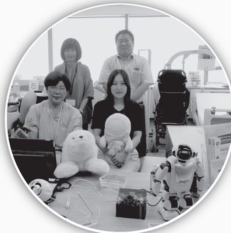
写真：サンシップとやま 2 階「とやま介護テクノロジー普及・推進センター（介テクセンター）」の様子